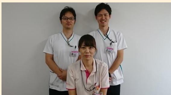
リハビリスタッフ

愛心訪問看護ステーションは、平成9年に開設し昨年20年を迎えました！鎌倉市内を中心に、子どもからお年寄りまで障がいや疾患があっても、住み慣れた場所で安心して過ごしていただくために、看護師や理学療法士、作業療法士が連携しながら定期的に訪問し療養生活の支援を行っています。医療依存度の高い人工呼吸器・腹膜透析等の医療機器やストーマ、床ズレ等の医療処置、点滴や経管栄養が必要な状態であっても、ご利用者様やご家族様が安心して療養介護が行えるように、24時間の緊急対応体制と土日祝日も営業し必要に応じて訪問しています。